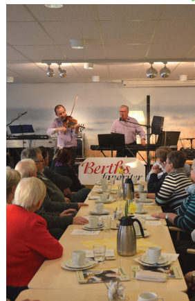
En brasafton i april - artister, kaffe och gemenskap.

Du är hjärtligt välkommen till oss som volontär!